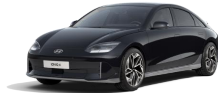
Abyss Black -helmiäisväri (A2B)