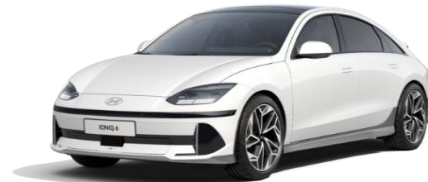
Serenity White -helmiäisväri (W6H)