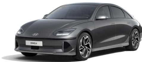
Nocturne Grey -metalliväri (T2G)