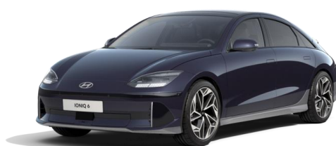
Biophilic Blue -helmiäisväri (XB9)