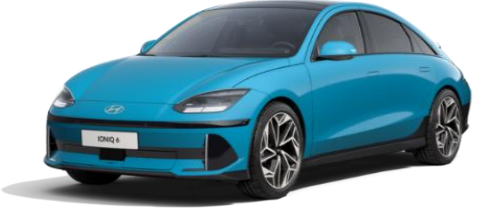
Byte Blue -helmiäisväri (UCB) veloitukseton

Sähköautojen kulutuksen ja toimintamatkan mittaustavan (WLTP) ilmoitetut arvot on tarkoitettu eri automallien väliseen vertailuun. Ne perustuvat keskiarvoa jättäville WLTP (Worldwide harmonised Light-duty Vehicles Test Procedure) -mittaukseen, eivätkä ne kuvaa auton kulutusta kaikissa olosuhteissa. Auton kulutukseen ja toimintamataan sähköllä vaikuttavat muun muassa lämpötila, keli- ja ajo-olosuhteet, kuljettajan ajotapa, ajonopeus, lisävarusteet, rengastus sekä auton kuormaus. Kylmissä olosuhteissa sähköauton toimintamatka lyhentyä huomattavasti ja hetkellisesti kulutus voi olla jopa moninkertainen ilmoitettuun WLTP lukemaan verrattuna.