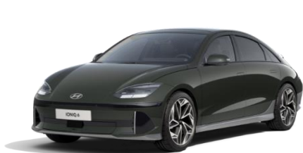
Digital Green -helmiäisväri (RG9)

Metalli-, erikois- tai helmiäisväri, ovh 699 € Mattaväri, ovh 899 €