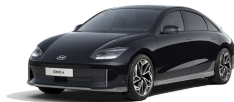
Abyss Black -helmiäisväri (A2B)