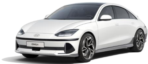
Serenity White -helmiäisväri (W6H)