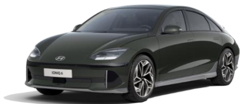
Digital Green -helmiäisväri (RG9)