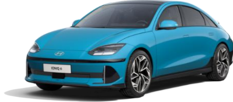
Byte Blue -helmiäisväri (UCB) veloitukseton

Sähköautojen kulutuksen ja toimintamatkan mittaustavan (WLTP) ilmoitetut arvot on tarkoitettu eri automallien väliseen vertailuun. Ne perustuvat keskiarvoa jättäen jäljelle WLTP (Worldwide harmonised Light-duty Vehicles Test Procedure) -mittaukseen, eivätkä ne kuvaa auton kulutusta kaikissa olosuhteissa. Auton kulutukseen ja toimintamataan sähköllä vaikuttavat muun muassa lämpötila, keli- ja ajo-olosuhteet, kuljettajan ajotapa, ajonopeus, lisävarusteet, rengastus sekä auton kuormaus. Kylmissä olosuhteissa sähköauton toimintamatka lyhentyä huomattavasti ja hetkellisesti kulutus voi olla jopa moninkertainen ilmoitettuun WLTP lukemaan verrattuna.