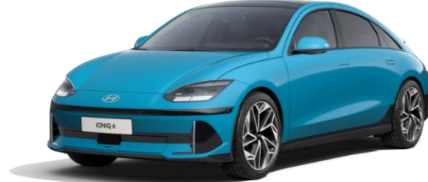
Byte Blue -helmiäisväri (UCB) veloitukseton