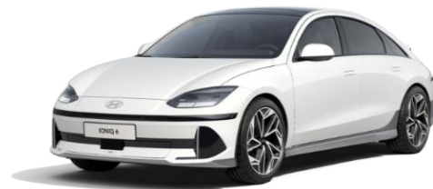
Serenity White -helmiäisväri (W6H)