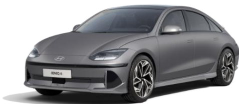
Nocturne Grey -mattaväri (T9M)