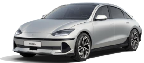
Gravity Gold -mattaväri (W3T)