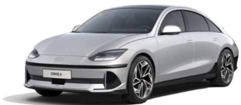
Curated Silver -metalliväri (R9S)