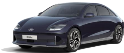
Biophilic Blue -helmiäisväri (XB9)