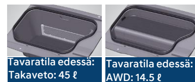
Tavaratila edessä: Takaveto: 45 l