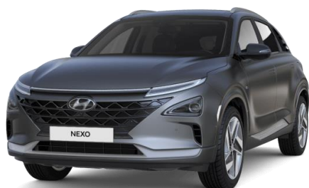
Titanium Grey (Y3G) - mattaväri