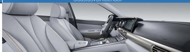
Stone Gray / Musta (SRX)