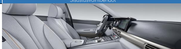
Stone Gray / Musta (SRX)