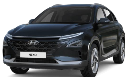
Ocean Indigo (PS8) - veloitukseton helmiäisväri