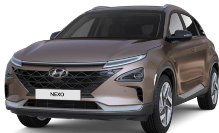
Copper (R3C) - metalliväri