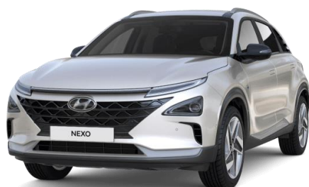
Creamy White (TW3) - helmiäisväri