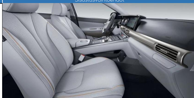
Stone Gray / Musta (SRX)