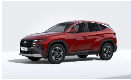
Ultimate red (R1P) Helmiäisväri