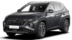
Dark Knight (YG7) -helmiäisväri