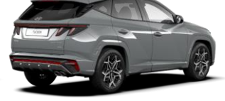
Shadow Gray/ Phantom Black -katto (TK1) (Saatavilla vain N Line -malliin)