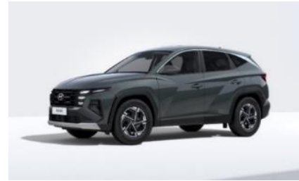
Cypress Green (T2P) Helmiäisväri