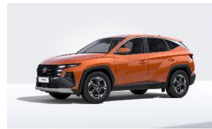
Jupiter Orange (PL2) Metalliväri