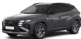
Ecotronic Grey (PE2) Helmiäisväri Ecotronic Grey / Musta katto (PE0)