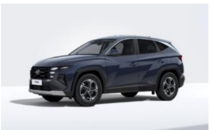
Sailing Blue (U2P) Metalliväri