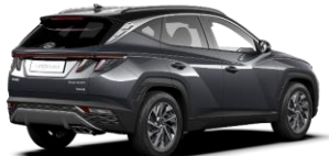
Dark Knight/ Phantom Black -katto (YG1)