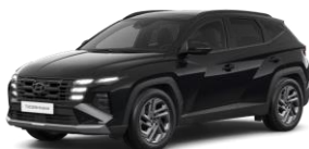
Abyss black (A2B) Helmiäisväri