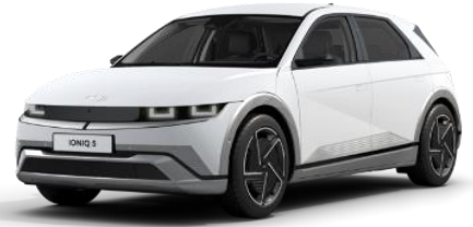
Atlas White matta (WAM)