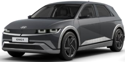
Ecotronic Gray helmiäsväri (PE2)