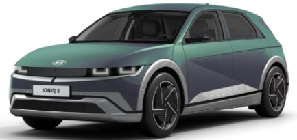
*Digital Teal Green helmiäsväri (M9U)