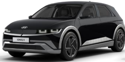
Abyss Black helmiäsväri (A2B)