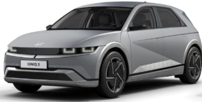
Gravity Gold matta (W3T)