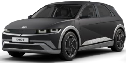
Ecotronic Gray matta (NET)