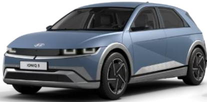
*Lucid Blue helmiäsväri (U3P)