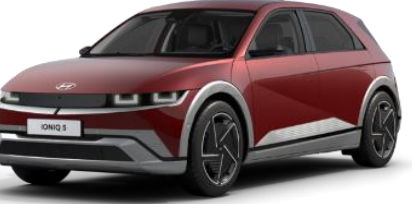
Ultimate Red metalliväri (R2P) veloitukseton vaihtoehto

Sähköautojen kulutuksen ja toimintamatkan mittaustavan (WLTP) ilmoitetut arvot on tarkoitettu eri automallien väliseen vertailuun. Ne perustuvat keskiarvoa jättävilleen WLTP (Worldwide harmonised Light-duty Vehicles Test Procedure) -mittaukseen, eivätkä ne kuvaa auton kulutusta kaikissa olosuhteissa. Auton kulutukseen ja toimintamataan sähköllä vaikuttavat muun muassa lämpötila, keli- ja ajo-olosuhteet, kuljettajan ajotapa, ajonopeus, lisävarusteet, rengastus sekä auton kuormaus. Kylmissä olosuhteissa sähköauton toimintamatta lyhentyä huomattavasti ja hetkellisesti kulutus voi olla jopa moninkertainen ilmoitettuun WLTP lukemaan verrattuna.