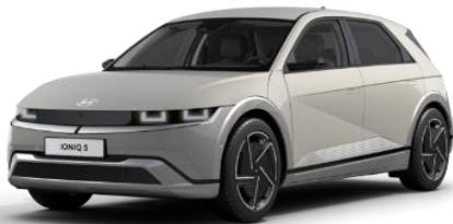
Cyber Gray metalliväri (C5G)