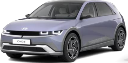
*Meta Blue helmiäsväri (PM2)