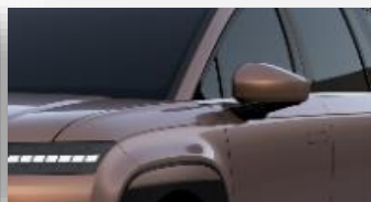
Sunset Brown (R5P) helmiäisväri