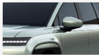
Celadon Gray (Y2G) metalliväri