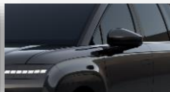
Abyss Black (A2B) helmiäisväri