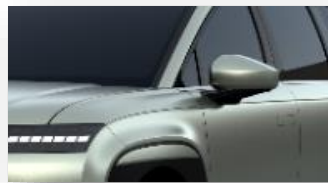
Celadon Gray (Y2T) mattaväri