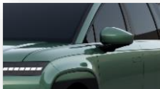
Ionosphere Green (NH5) helmiäisväri