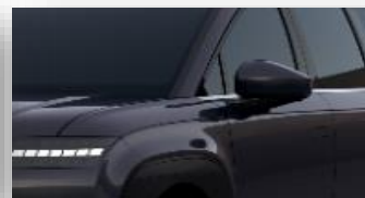
Biophilic Blue (XB9) helmiäisväri