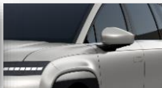
Gravity Gold (W3T) mattaväri

Sähköautojen kulutuksen ja toimintamatkan mittaustavan (WLTP) ilmoitetut arvot on tarkoitettu eri automallien väliseen vertailuun. Ne perustuvat keskiarvoajoa jäljittelevään WLTP (Worldwide harmonised Light-duty Vehicles Test Procedure) -mittaukseen, eivätkä ne kuvaa auton kulutusta kaikissa olosuhteissa. Auton kulutukseen ja toimintamataan sähköllä vaikuttavat muun muassa lämpötila, keli- ja ajo-olosuhteet, kuljettajan ajotapa, ajonopeus, lisävarusteet, rengasus sekä auton kuormaus. Kylmissä olosuhteissa sähköauton toimintamatta lyhentyä huomattavasti ja hetkellisesti kulutus voi olla jopa moninkertainen ilmoitettuun WLTP lukemaan verrattuna.