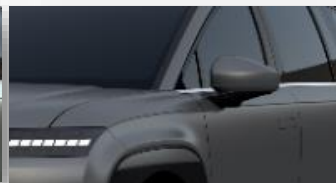
Nocturne Gray (T9M) mattaväri