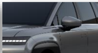
Nocturne Gray (T2G) metalliväri