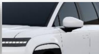
Serenity White (W6H) helmiäisväri