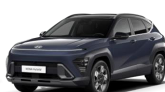
Denim Blue, перламутр (TN0) / черная крыша