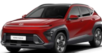
Ultimate Red, металл (R2P)