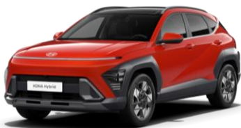
Soultronic Orange, перламутр (SOP)*