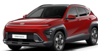
Ultimate Red, металлик (R2P)