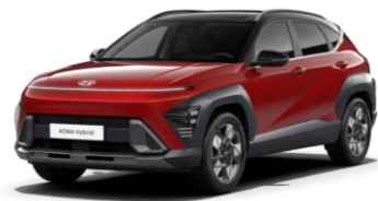
Ultimate Red, металл (R20) / черная крыша