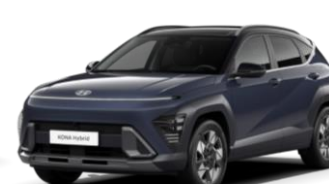
Denim Blue, перламутр (TN0) / черная крыша