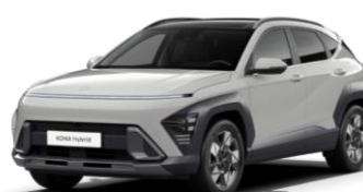
Cyber Grey, металлик (CSG)