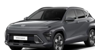
Ecotronic Gray, перламутр (PE2)