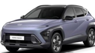
Meta Blue, перламутр (PM0) / черная крыша*