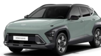
Mirage Green (RR0) / черная крыша