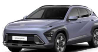
Meta Blue, перламутр (PM2)*