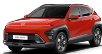
Soultronic Orange, перламутр (SOP)*