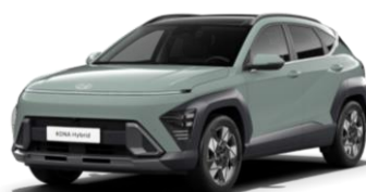
Mirage Green, сплошной (RRR)