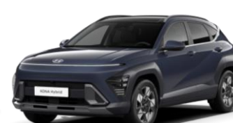
Denim Blue, перламутр (TN6)