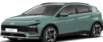
MG2 Mangrove Green, цвет металлик, бесплатно