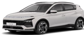
Y3H Lumen Gray, перламутровый