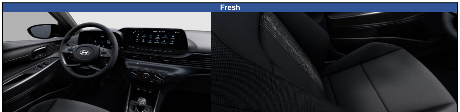
Интерьер черного цвета, сиденья с тканевой обивкой Fresh