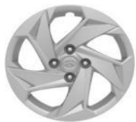
Стальные диски 6.0Jx15" Шины 185/65R15