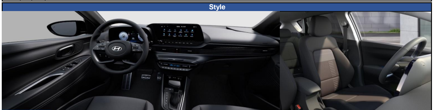
Интерьер черного цвета, сиденья с тканевой обивкой Comfort, металлические педали, внутренние дверные ручки в цвете металла