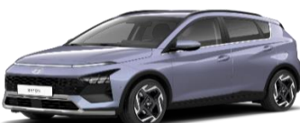
PM2 Meta Blue, перламутровый