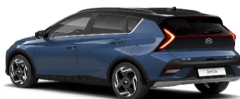
5UC Vibrant Blue/ Phantom Black