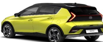
5NP Lucid Lime/ Phantom Black