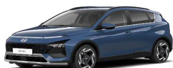
UC3 Vibrant Blue, перламутровый