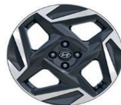
Литые диски Style 6.5x17" Шины 205/55/R17

5 ЛЕТ Гарантия неограниченная по пробегу