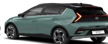
5MG Mangrove Green/ Phantom Black