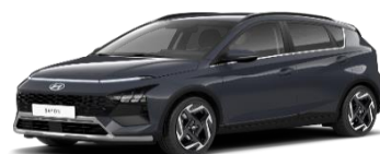
A7G Aurora Grey, перламутровый