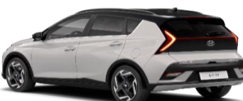
5Y3 Lumen Grey/ Phantom Black