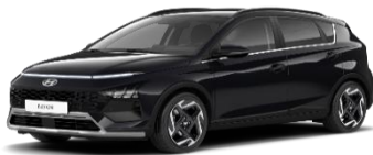
X5B Phantom Black, перламутровый