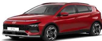
WR7 Dragon Red, перламутровый