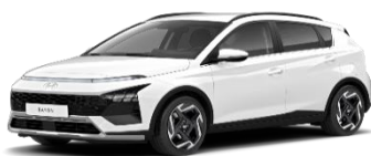
SAW Atlas White, специальный

Крыша и боковые зеркала – Phantom Black 490 €