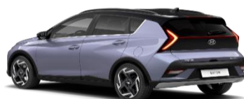
5PM Meta Blue/ Phantom Black