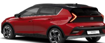
5WR Dragon Red/ Phantom Black