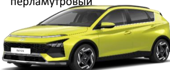
N6M Lucid Lime, цвет металлик