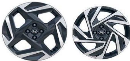
Литые диски Style 6.5x17" Шины 205/55/R17 Опционально (бесплатно): Литые диски 6.0Jx16", шины 195/55R16