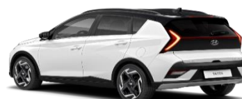
5SA Atlas White/ Phantom Black