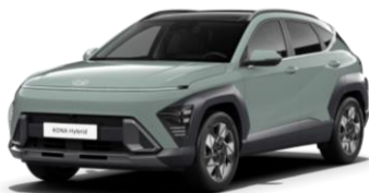
Mirage Green, сплошной (RRR)