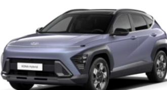
Meta Blue, перламутр (PM0) / черная крыша*