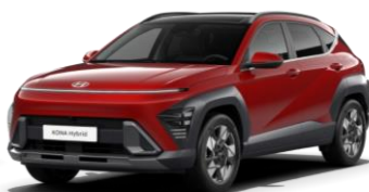
Ultimate Red, металл (R2P)