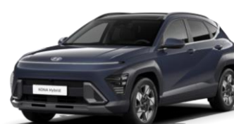
Denim Blue, перламутр (TN6)