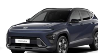
Denim Blue, перламутр (TN0) / черная крыша