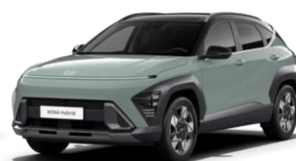
Mirage Green (RR0) / черная крыша