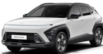
Atlas White (SA0) / melns jumts

Phantom Black – melns jumts Phantom Black – melns jumts 590 €