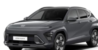
Ecotronic Gray perlmutra (PE2)