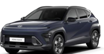
Denim Blue perlamutra (TN0) / melns jumts