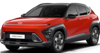
Soultronic Orange perlamutra (SO0) / melns jumts*