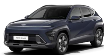
Denim Blue perlamutra (TN6)