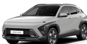
Cyper Grey metāliska (C5G)