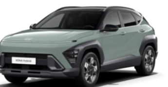
Mirage Green (RR0) / melns jumts