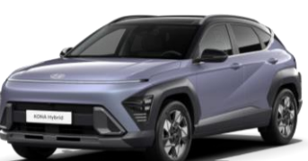
Meta Blue perlamutra (PM0) / melns jumts*