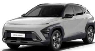
Cyper Grey metāliska (C50) / melns jumts