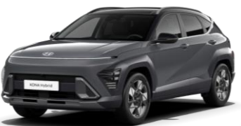
Ecotronic Gray perlamutra (PE0) / melns jumts