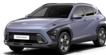
„Meta Blue“ mėlyna perlamutrinė (PM2)*