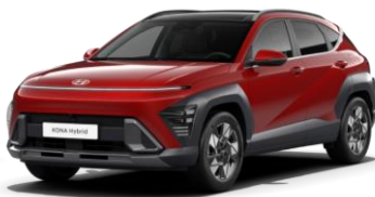
„Ultimate Red“ raudona metalo blizgesio (R2P)