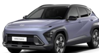
„Meta Blue“ mėlyna perlamutrinė (PM0)* / juodas stogas