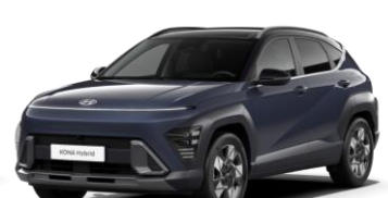
„Denim Blue“ tamsiai mėlyna perlamutrinė (TN0) / juodas stogas