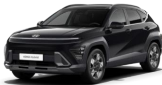
„Abyss Black” juoda perlamutrinė (A2B)

„Mirage Green” pilkai melsva – nemokama 0 € Metalo blizgesio ir perlamutrinė spalva 550 €