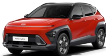
„Soultronic Orange“ oranžinė perlamutrinė (S00)* / juodas stogas