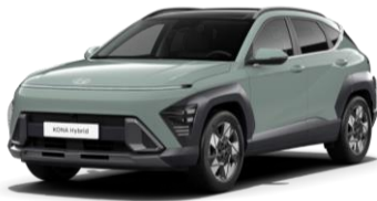
„Mirage Green“ pilkai melsva (RRR) - nemokamai