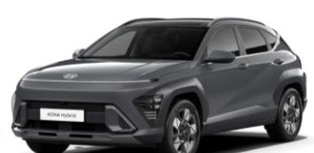
„Ecotronic Gray” pilka perlamutrinė (PE2)