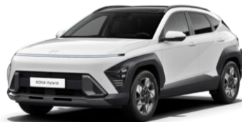
„Atlas White” balta (SAW)