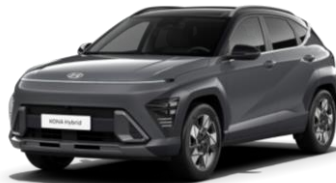
„Ecotronic Gray“ pilka perlamutrinė (PE0) / juodas stogas