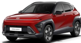
„Ultimate Red“ raudona metalo blizgesio (R20) / juodas stogas