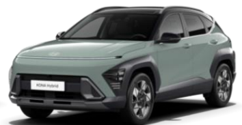
„Mirage Green“ pilkai melsva (RR0) / juodas stogas