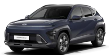
„Denim Blue“ tamsiai mėlyna perlamutrinė (TN6)