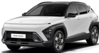
„Atlas White“ balta (SA0) / juodas stogas

„Phantom Black“ juodas stogas „Phantom Black“ juodas stogas 590 €